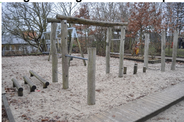
Redskab: Legeredskab Producent: Nordleg Er redskabet mærket: Ja Emne 1: Er der registreret fejl / mangler: Nej