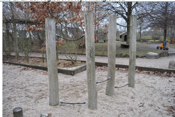
Redskab: Balance redskab Producent: Norleg Er redskabet mærket: Ja Emne 4: Er der registreret fejl / mangler: Nej