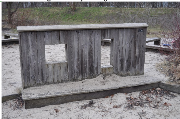
Redskab: Legeredskab Producent: Hede Danmark Er redskabet mærket: Ja Emne 9: Er der registreret fejl / mangler: Nej