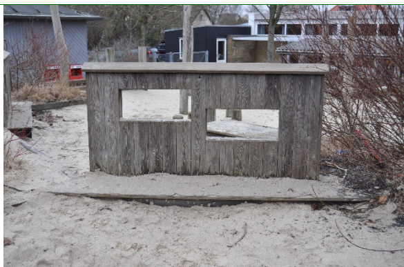
Redskab: Legeredskab Producent: Er redskabet mærket: Nej Emne 7: Er der registreret fejl / mangler: Ja