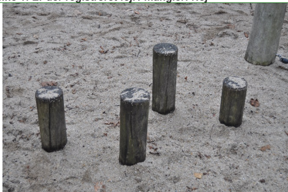
Redskab: Balance stolpe Producent: Er redskabet mærket: Nej Emne 3: Er der registreret fejl / mangler: Ja