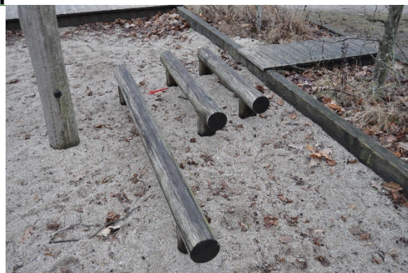
Redskab: Balance bom Producent: Er redskabet mærket: Nej Emne 2: Er der registreret fejl / mangler: Ja