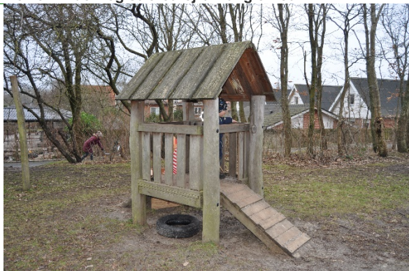
Redskab: Legehus Producent: Norleg Er redskabet mærket: Ja Emne 15: Er der registreret fejl / mangler: Ja