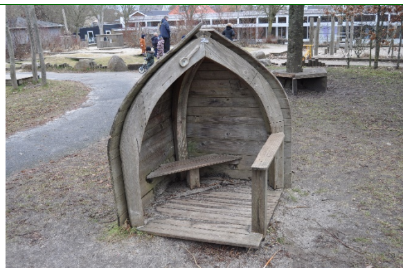
Redskab: Legehus Producent: Norleg Er redskabet mærket: Ja Emne 14: Er der registreret fejl / mangler: Ja