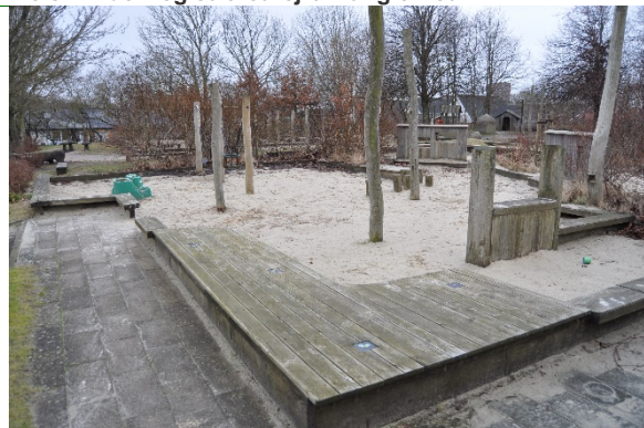
Redskab: Sandkasse Producent: Er redskabet mærket: Nej Emne 10: Er der registreret fejl / mangler: Ja