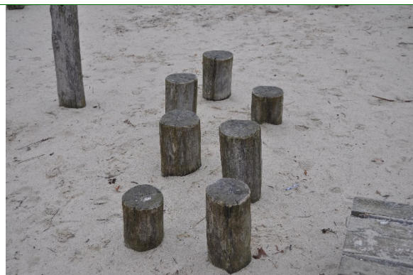
Redskab: Balance stolpe Producent: Er redskabet mærket: Nej Emne 8: Er der registreret fejl / mangler: Ja