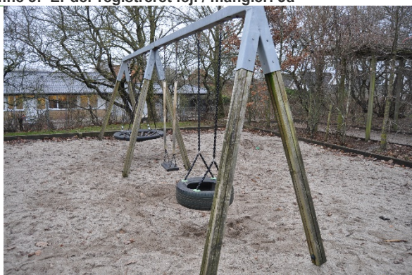
Redskab: Gynger Producent: Rudeco Er redskabet mærket: Ja Emne 5: Er der registreret fejl / mangler: Ja