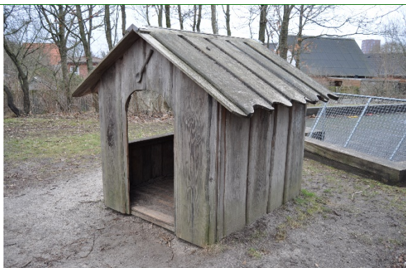
Redskab: Legehus Producent: Norleg Er redskabet mærket: Ja Emne 13: Er der registreret fejl / mangler: Ja